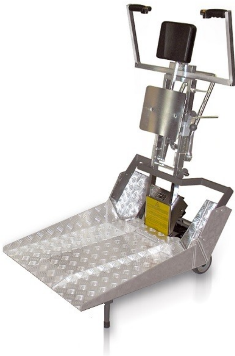
JOLLY 150 MINI RAMPY