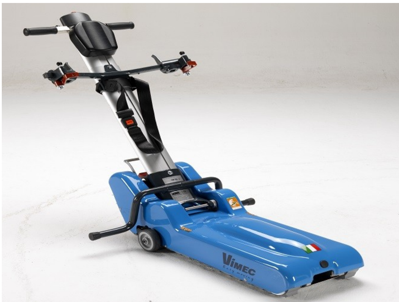
VIMEC T09 ROBY